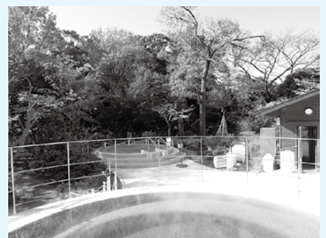
屋外天然温泉ジャグジー