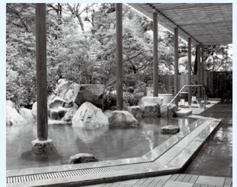
天然温泉露天風呂