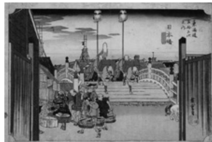
歌川広重《東海道五拾三次之内 日本橋・朝之景》 1833-36(天保4-7)年頃 大判錦絵 山種美術館 [前期展示12/10-1/15]